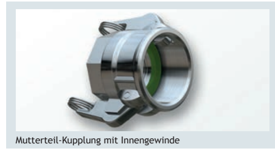
Mutterteil-Kupplung mit Innengewinde