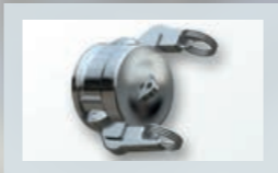
Kappen mit Hebelarmsicherung