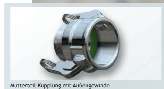
Mutterteil-Kupplung mit Außengewinde