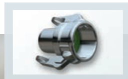
Mutterteil-Kupplungen mit Schlauchstutzen und Hebelarmsicherung