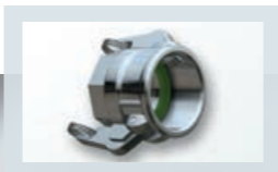
Mutterteil-Kupplungen mit Innengewinde und Hebelarmsicherung